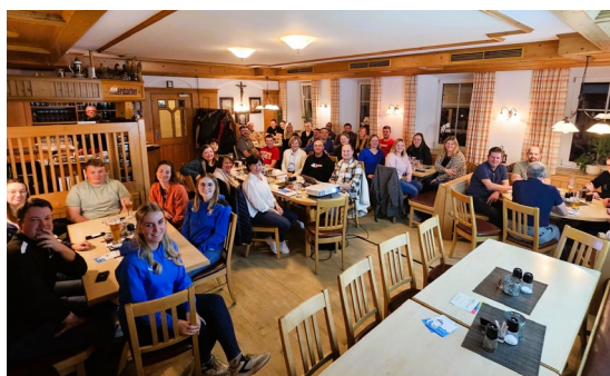
Stammtisch des Vereinsnetzwerkes „Miteinander im Ehrenamt“ in Falkenberg