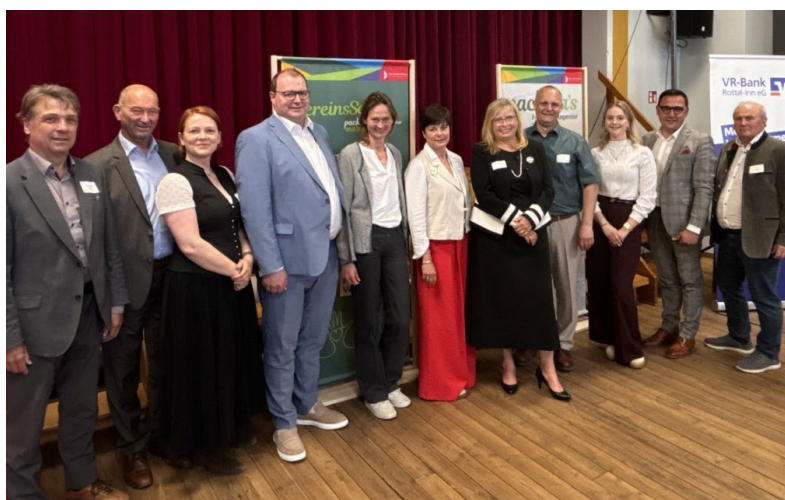
Auftakt der VereinsSchule Rottal-Inn