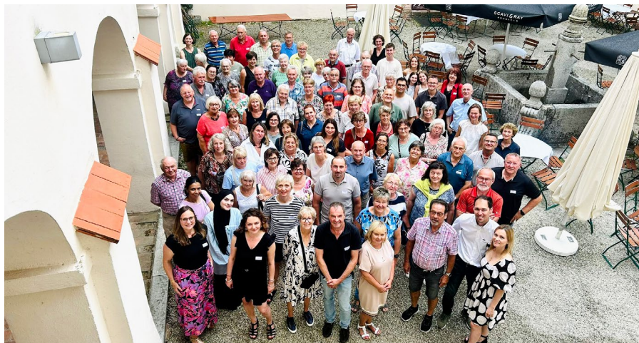
Ehrenamtstreffen 2025, Ehrenamtliche der Tafel Arnstorf und des Integrationsprojektes ZukunftsStarter