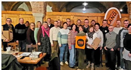
Stammtisch des „Vereinsnetzwerkes in und um Arnstorf“